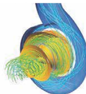
Dinámica de fluidos

TRES MIL OCHOCIENTOS DÓLARES VALOR DEL DOLAR VENTA BANCO COMUN